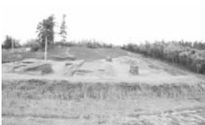
亭子桥原始青瓷窑址发掘全景