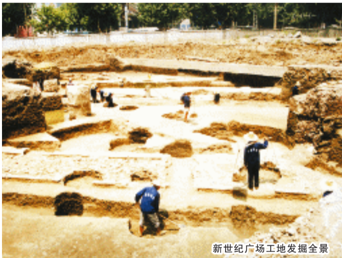
新世纪广场工地发掘全景

20世纪30年代日本人小山富士夫首次对位于德清老县城城关镇(现改为乾元镇)的几处窑址进行了实地调查并采集了部分标本,他在《支那青瓷史稿》“越州古窑址”下有“德清古窑”条。20世纪50年代,因工程建设等原因,汪扬、王士伦等考古界前辈先后对德清老县城丁山、小马山、城山、焦山等窑址重新进行了调查,提出了“德清窑”的概念,并总结其突出成就就是黑釉瓷的创烧和化妆土的运用,德清窑作为当时最早烧造黑瓷的窑址而受到古陶瓷界的瞩目。之后,以县域命名的窑口开始多起来如上虞窑、萧山窑等,实际上古人烧造瓷器当然不会按今天的行政区划来布局,1974年在余杭良渚大陆一带发现了类似的窑址,所以德清窑的分布范围从德清县老县城地区扩大到了东苕溪上游地